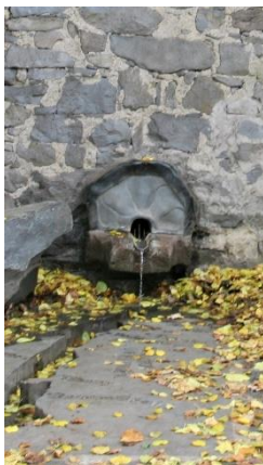
19. kép A Kisfaludy-forrás

A népi barokk stílusú emeletes, nádfedeles présház Szegedy Róza és Kisfaludy Sándor kedvenc nyári tartózkodási helye volt. Az emeleti 4 szobás, erkélyes lakótér alatt, a földszinten található a boltozott pince és a présház, az itt kialakított Ürmös Borozóban megkóstolhatjuk többek között a ház specialitását, a Szegedy Róza receptje alapján készített ürmösbort . Az emeleten ma Kisfaludy Sándor , a "Himfy szerelme" szerzőjének életútját és munkásságát bemutató kiállítás látható. Kisfaludy a költészet mellett igen aktív közéleti személyiségként a Magyar Tudományos Akadémia tiszteletbeli tagja , a Kisfaludy Társaság rendes tagja is volt. A politikai közéletben is kivette részét: Zala megye (és több más megye is) táblabírájának választotta . Ez nagyban segítette pl. abban, hogy Balatonfüreden megalapítsa a város és az egész Dunántúl első kőszínházát .