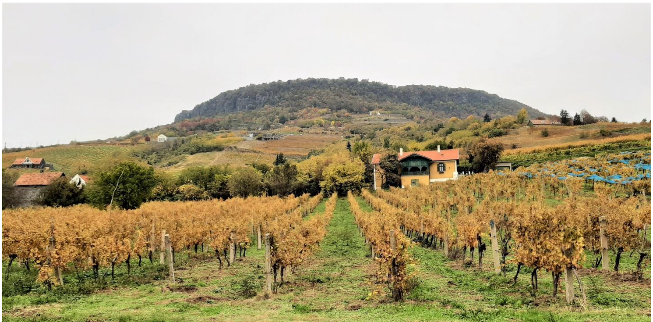
13. kép A szőlőhegyi présházak és Badacsony bazaltkúpja

A szőlőbirtokok fölött szürke bazaltsziklák alkotta, a távolból koporsóra emlékeztető bazalttető, bazaltsapka látható egy erdősáv felett.