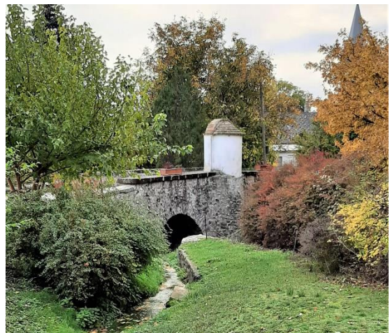
2. kép A Nepomuki Szent János híd, Örvényes

A malom ma a volt molnárnak köszönhetően múzeum. A régi berendezések megmaradt alkatrészei, archív fényképek, valamint a Balaton-felvidékről összegyűjtött néprajzi-helytörténeti emlékek, bútorok segítenek felidézni az egykori molnárok életét.