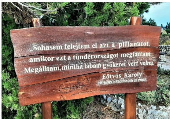
31. kép Eötvös Károly, a Szépkilátóról

Martyn Ferenc (festőművész), Tőrek Ferenc (grafikus), Pogány Ödön Gábor (a Szépművészeti Múzeum volt igazgatója), Raksányi Gellért (színművész), Széchenyi Zsigmond (Afrika kutató, vadász, író).