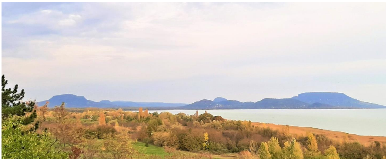
30. kép A Balaton legszebb panorámája a Szépki látóról. Előtérben ( balról) a Szt. György-hegy, középen Szigliget a várrommal és az Ófaluval, jobbra a Badacsony bazalt fennsíkjaival

Szigligetről Balatongyörök–Szépki látó kitérővel utazunk Sümegre, (37 km). Balatongyörök a 12. sz-ban egy római település romjára épült. Nevét valószínűleg Szigliget urának, II. Atyusz bánnak Gyürk nevű fiáról kapta. A Szépki látónál a Balaton legszebb panorámája tárul elénk a Tapolcai medence tanúhegyeivel, várromjaival: Badacsony, Szent György-hegy, Csobánc, Szigliget, Gulács, Tóti-hegy, Haláp, Somló-hegy, a Kis-Somló és a Ság-hegy. A látvány annyira lenyűgöző, hogy állandóan nagyon sok látogatót vonz.