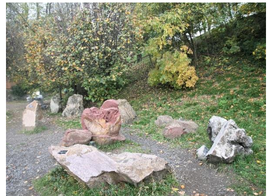
5. kép Kilátás a Hegyestű tetejéről Badacsony felé (balra)