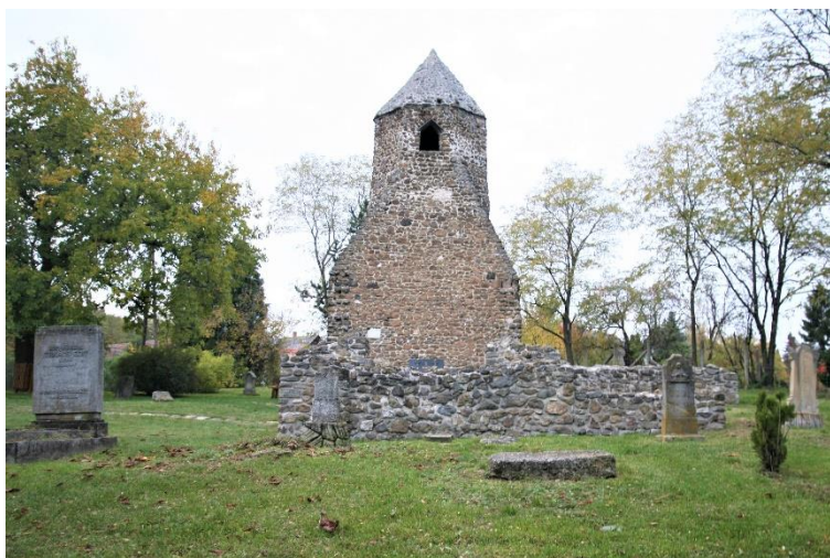
26. kép Az Avasi templomrom a régi temetővel, Szigliget

az út építése során is) nagy mennyiségben talált csontok bizonyítják. A ma is látható néhány sír jóval későbbi. A vár felépülése, majd bővítése okozta a falu fokozatos elnéptelenedését. A falu lakói a Várhegy alatti, a nagyobb biztonságot nyújtó Újfaluba, (a mai Ófaluba) költöztek át. Egy 15. sz. elején keletkezett okirat szerint, a teljesen elnéptelenedett régi faluban még állt a Mindenszentek tiszteletére épült kőtemplom. A török időkben végleg összedőlt templom köveinek jó részét a későbbi építkezésekhez hordták el.