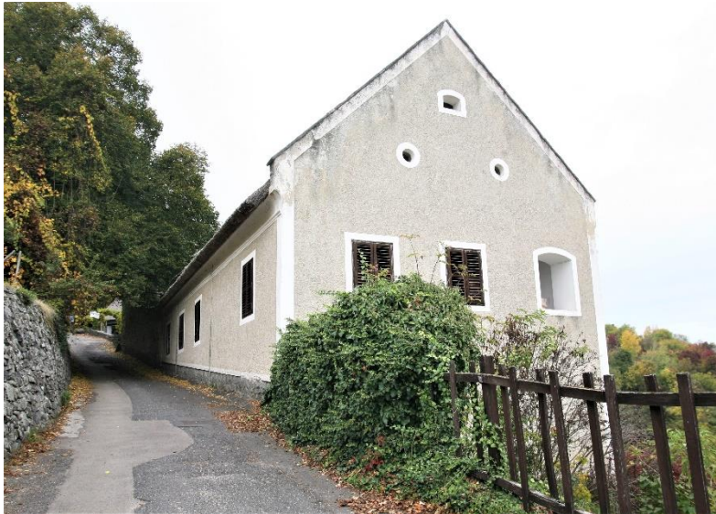
17. kép Szegedy Róza egykori présháza - Irodalmi és Bormúzeum

Szegedi Róza háza egykor présház volt, ma Irodalmi és Bormúzeum , benne az Ürmösház Borozóval . (Nyitva: május 1. és szeptember 30. között)