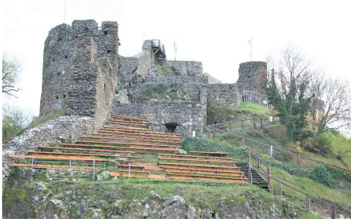
24. kép A Felső-vár, Szigliget

volt, és komoly erőt képviselt. Először a 16. sz-i bővítmény rondelláját az ágyúkkal, majd a kerek keleti tornyát látogatjuk meg, A rondella az őt építő Martonfalvay Imre deákról Török Bálint várkapitányáról kapta a nevét, aki a Felsővárat ezen elővédekkel megerősítette.