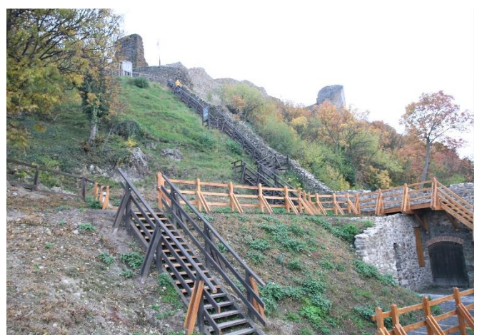
23. kép Lépcsősor a felső várhoz, Szigliget

megrendezésre. A falépcsőkön felmászva a felső várban tárul elénk annak meglepően tágas területe, a 16. sz-i ún. északi bővítménnyel. Így a két vár együtt kiválóan védhető