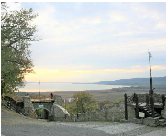
22. kép Balatoni kilátás a várból, baloldalt a Palonai Magyar Bálint -torony romja

Mellette a néhai lóistállóban kovácsműhelyt láthatunk, az udvaron a fölénk magasodó romos felsővár előtt szabadtéri színpad áll, ahol nyaranta a Szigligeti Várjátékok kerülnek