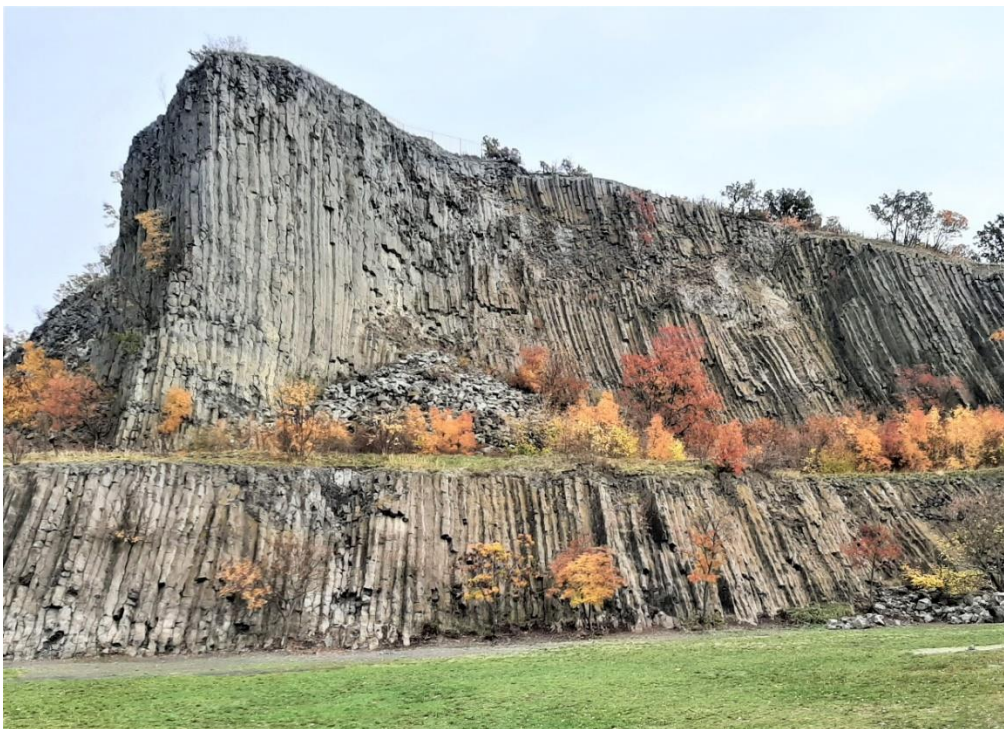
4. kép Hegyestű, a vulkáni kráter maradványa a bazaltoszlópokkal