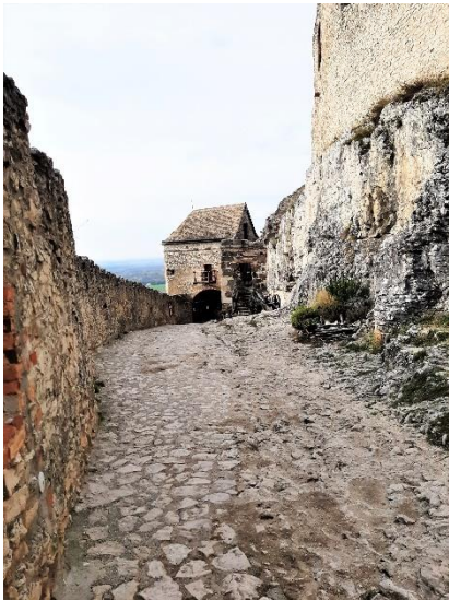
34. kép A Külső és Belső kaputorony közötti falszoros, Sümegi vár

az ellenséges ostromoknak, az új püspök, Köves András nagyszabású építkezésbe kezdett az olasz Giovanni Speciacasa építész segítségével. Megépült a vár északi sarkán a kétszintes, nagyméretű, ötszög alaprajzú Köves-bástya, és egyéb védművek. Nyolc év építkezés után 1562-ben egy villámcsapás felrobbantotta az Öregtoronyban tárolt lőport, a tűzvészben elpusztult a vár egy része és a tetőszerkezet, melyek kijavítására 200 forintot utalt ki Miksa főherceg. Ezt követően átépítették az egész belső várat, a tornyot, és a vár lakóépületeit is átalakították reneszánsz stílusban.