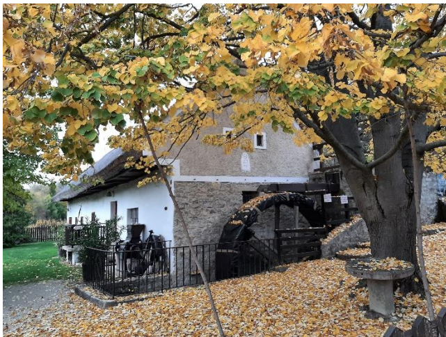
1. kép Az Örvényesi Vizimalom-Múzeum

1956-ban technológiai váltás következett be, a malomkővet hengersizékes változatra cserélték (a hengersizék feltalálója , tökéletesítője Mechwart András volt, amellyel Magyarország malomipari nagyhatalommá vált a 19. sz-ban).