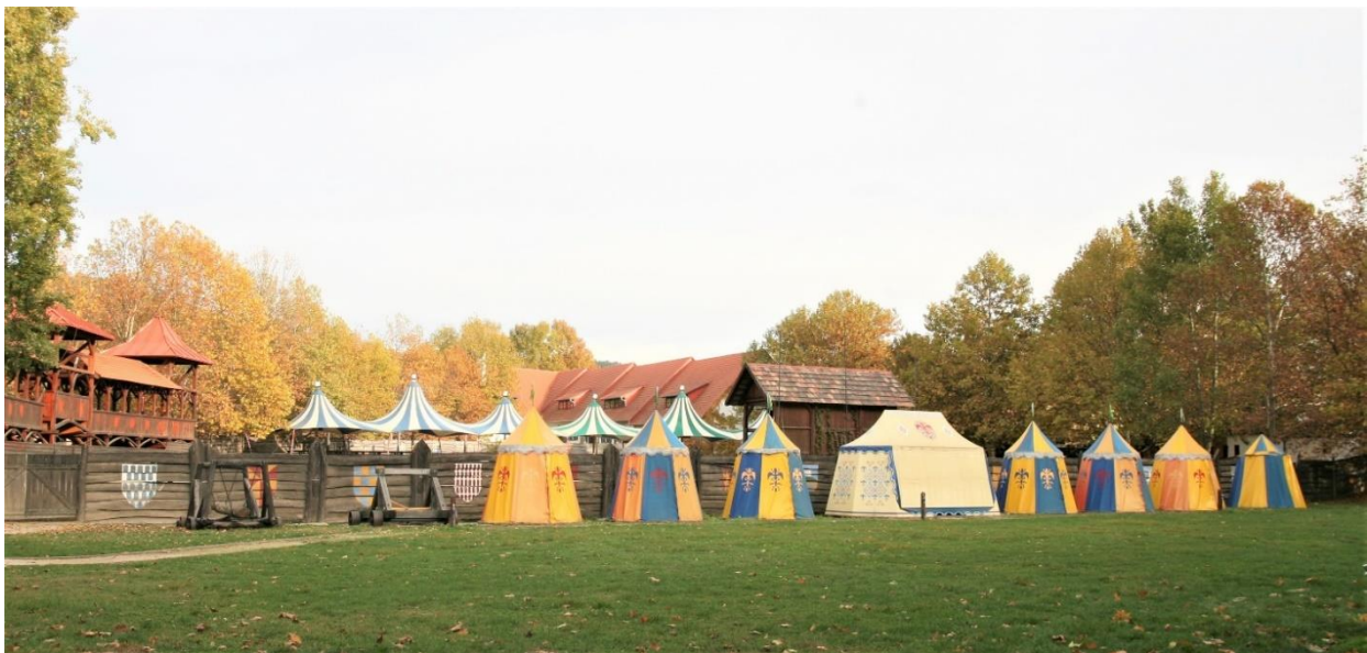
46. kép Török sátrak a Történelmi Emlékparkban, mögöttük a Lovagi torna helyszíne

Visszatérve a Szent István térre, a mellette lévő Kisfaludy téren áll Kisfaludy Sándor szülőháza, ma Kisfaludy Emlékház és Városi Múzeum. Kisfaludy a bécsi testőri, majd katonai pályafutása végeztével, a napóleoni háborúk után költözött vissza ide a Szegedy Rózával történt házasságkötését követően, és itt is hunyt el, gyermektelenül. Halála után a rokonság a veszprémi püspökségnek adományozta a házat, ahol az egyházi birtokok állami tulajdonba vételéig a püspökség mindenkori intézője lakott. 1950 óta emlékmúzeum, amely 1990-től Városi Múzeumként több tárlattal is bővült. Újabban a városi rendezvények alkalmával az emlékház is bekapcsolódik a programokba szakmai előadásokkal, népzenei, komolyzenei koncertekkel, tematikus programokkal, kézműves bemutatókkal, így a rendezvények látogatói egyben megismerhetik a Kisfaludy gyűjteményt is. A kiállításon a költőnek, feleségének és testvérének, a szintén költő Kisfaludy Károlynak személyes tárgyait nézhetjük meg, emellett eredeti kézírataiból láthatunk válogatást.