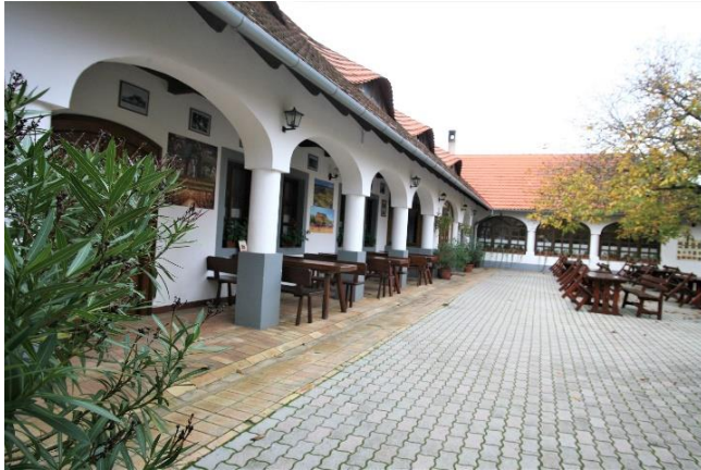
47. kép A Csárda helyén állt Kisfaludy Mór 1848-as honvéd alezredes lakóháza

Visszatérünk a Történelmi Emlékparkba a vár alá, ahol időszakonként változó tematikájú harcászati kiállítás vár reánk. Láthatóak itt a régmúlt idők ostromeszközei, pl. kőhajítógépek, vagy török kori ágyúk, stb. Látogatásomkor egy török tábor sátrai álltak a fedett tribünnel rendelkező lovaspálya mellett, amely a Lovagi tornák nyári helyszíne is.