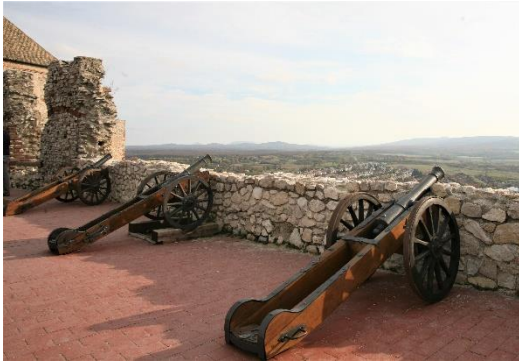
40. kép Ágyúk a mellvéden, a nyugati falon, Sümeg

A Sümegi várban a Nemzeti Várprogram részeként egy kb. két évig tartó, közel egymilliárd forintos felújítás kezdődött, amelynek során újjáépül az egész keleti szárny, a kápolnától egészen a Köves-bástyaig . Megújul az első szinten a várnagyi ház, a kaszárnya, a középkori konyha, a sütőház, a bognár- és kovácsműhely, a külső várfalhoz pedig tölgyfából, faszindellyel fedett gyilokjárók készülnek. A második szinten új termek