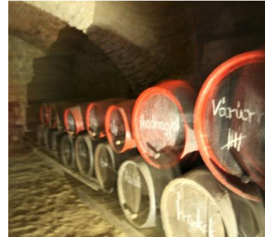
37. kép A vár Borospincéje, Sümeg

A Darabontok szobájában páncélos őröt látunk, a belső udvaron jobbra a lépcsőkön a Fellegvárba mehetünk fel. A fedett belső falszorosban balra a szépen felújított Várkápolnába jutunk, amelyet ifj. Vitéz János püspök építtetett a 16.sz-ban. Vele