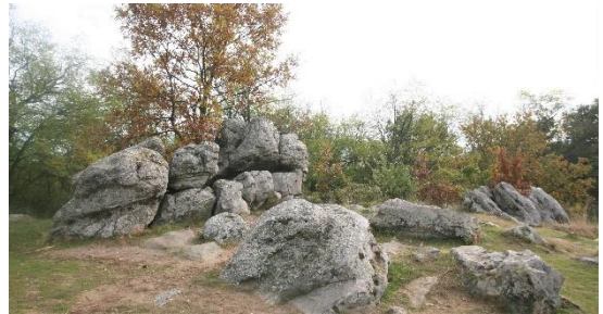
10-11-12. képek Bizarrr őslény és állatformák, kőhalmok, Szentbékállai kőtenger

kőtömbökkel borított, ligetes erdőben járunk a látványos sziklaalakzatok között, fel is lehet mászni az impozáns homokkő formációkra. Kitűnő családi program, nem kell sokat gyalogolni, kisebb gyerekek is nagyon élvezik a sziklalabirintusban való bújócskázást. A kőtenger központi helyén magasodik a kisebb ház nagyságú, gigászi Kelemen-kő, vagy Ingókő . Legfelső, közel 10 tonnás kőpadja csak három ponton támaszkodik az alatta fekvő tömbre. Így akár egy ember is képes a kőlap tetején, a megfelelő pontra állva, hintáztatni és billegtetni a monstrumot.