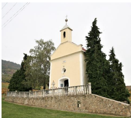
16. kép A szőlőhegyi Szent Anna-kápolna