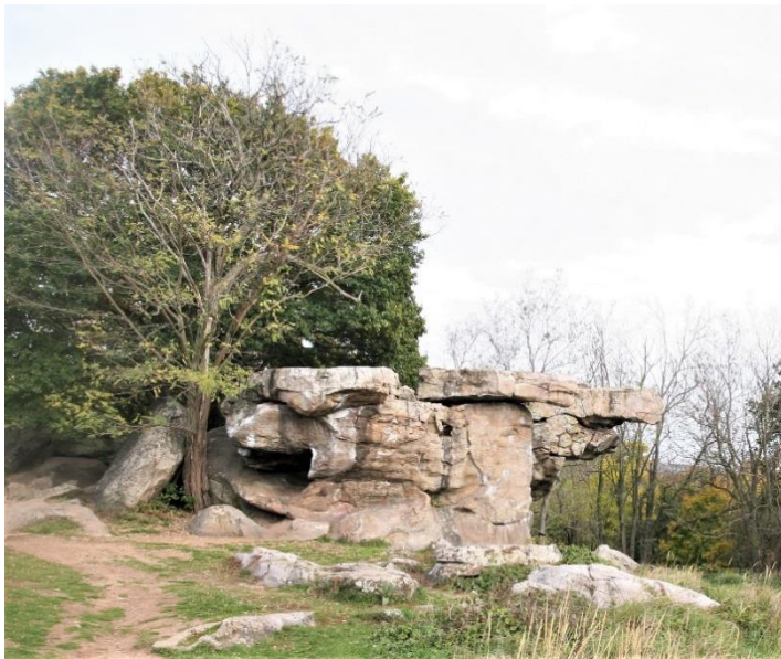
9. kép A gigászi Kelemen-kő vagy Ingókő, Szentbékálla

A jól járható földúton a falu szélső házait és a Kálváriát elhagyva kis séta után jobbra látható az információs tábla a kőtenger leírásával. Dimbes-dombos területen, a hatalmas