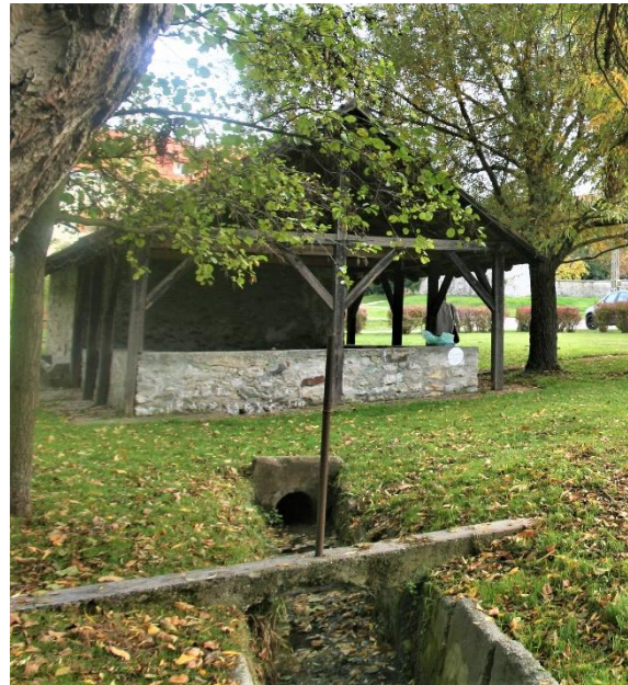
8. kép A Mosóház hátsó, fedett része, ahol a mosás folyt. Előtte a vízvezető árok

A mosóházak a közösségek életében is fontos helyszínek voltak: az asszonyok a hét meghatározott napjain jártak mosni, a hosszú, több órás tevékenység során jutott idő az információcserére, a pletykálkodásra is. A mosás igen nehéz és fáradságos fizikai munkának számított: a szennyes vászonneműt a háznál melegített vízzel szapulták (ez a helyi tájnyelvben nem szidást, hanem fahamuval készített lúgos vízben többszöri áztatást jelent). Utána teknőben a mosóhoz vitték, ahol addig csapkodták, majd átöblögették a ruhát, amíg patyolattiszta nem lett. A mosógödrök felett vastag deszkákat fektettek keresztbe, ezen guggoltak az asszonyok. Ezután következett a kicsavarás, majd otthon a szárítás és egyes ruháknál a mángorlás.