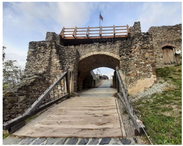
21. kép A felvonóhidas Török Bálint kaputorony romja, Szigligeti vár