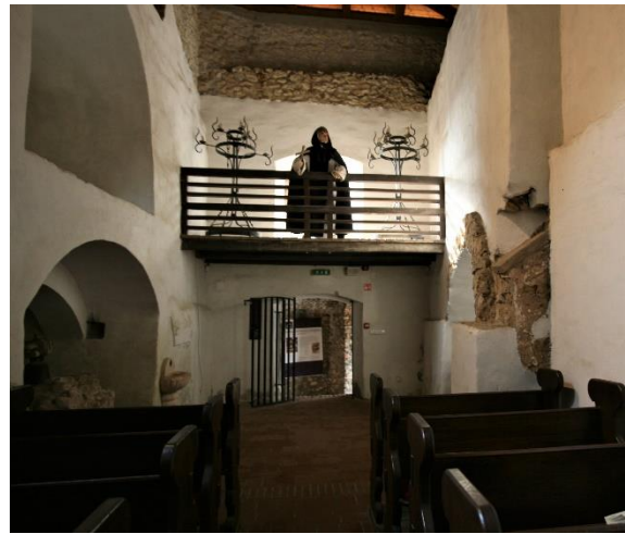
39. kép A Várkápolna karzata, Sümeg

átellenben a vár Borospincéje hívogat. Az Öregtoronyban megnézzük a Püspöki fogadószobát és a tanácstermet a szép zöld mázas cserépkályhával és reneszánsz bútorzatával, valamint a Püspöki hálószobát a nagy baldachinos ágygal. Az alsó szinten erős idegzetű látogatóit várja a Börtönkiállítás a kínzókamrával