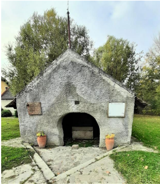
7. kép A Mosóház Köveskálán, benne a forrás nehai vízvételi medencéje

épített itatóvályúkból. A kút vize biztosította a falu mosóházában a mosást. A forrásokhoz kapcsolódtak például a tűzoltás, alkalmi vágóhíd (Kővágóörsön szombatoként, amikor nem volt szabad mosni), halastó, fürdő (Szentbékállán), szódavízkészítés, ásványvíz palackozás (Kékkút), stb. Kővágóörsön rituális zsidó fürdő is épült egy forrásra, amely a 2. világháború végéig üzemelt.