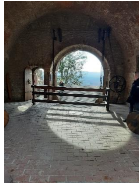
36. kép A Kapuköz a Belső kaputoronyban