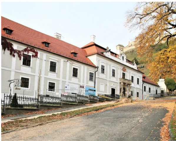
44. kép A sümegi Püspöki Palota a vár alatt, (fent)

A palota főhomlokzata a Várhegy mellett, a keleti oldalon még földszintes, középen és a nyugati szárnyrészben pedig emeletes. Legszebb része a kapuzat, amelyet két Atlasz szobor fog közre, a fejükön lévő korinthuszi oszlopfőkkel virágfüzérékkel ékesített mellvértes erkélyt tartanak, felette Bíró Márton püspöki címere látható.