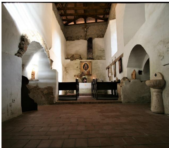
38. kép A Várkápolna, Sümeg

A Darabontok szobájában páncélos őröt látunk, a belső udvaron jobbra a lépcsőkön a Fellegvárba mehetünk fel. A fedett belső falszorosban balra a szépen felújított Várkápolnába jutunk, amelyet ifj. Vitéz János püspök építtetett a 16.sz-ban. Vele