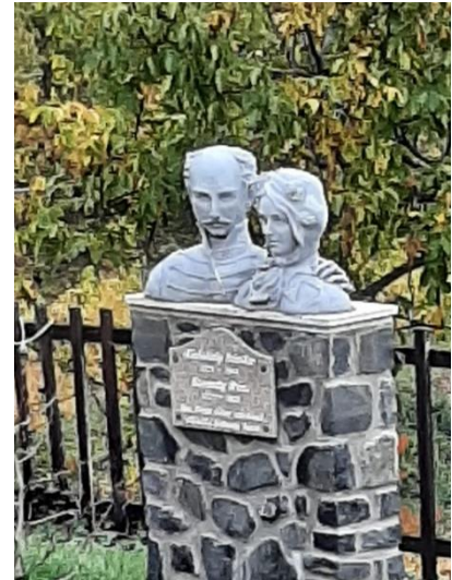
18. kép Kisfaludy Sándor és Szegedy Róza mellszobra a kertben

A népi barokk stílusú emeletes, nádfedeles présház Szegedy Róza és Kisfaludy Sándor kedvenc nyári tartózkodási helye volt. Az emeleti 4 szobás, erkélyes lakótér alatt, a földszinten található a boltozott pince és a présház, az itt kialakított Ürmös Borozóban megkóstolhatjuk többek között a ház specialitását, a Szegedy Róza receptje alapján készített ürmösbort . Az emeleten ma Kisfaludy Sándor , a "Himfy szerelme" szerzőjének életútját és munkásságát bemutató kiállítás látható. Kisfaludy a költészet mellett igen aktív közéleti személyiségként a Magyar Tudományos Akadémia tiszteletbeli tagja , a Kisfaludy Társaság rendes tagja is volt. A politikai közéletben is kivette részét: Zala megye (és több más megye is) táblabírájának választotta . Ez nagyban segítette pl. abban, hogy Balatonfüreden megalapítsa a város és az egész Dunántúl első kőszínházát .