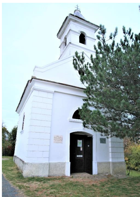
27. kép A Szőlőhegyi Szentháromság kápolna, Szigliget

építészeti ritkaság számba megy. Érdekessége, hogy a torony bejáratának nincs kapcsolata a templommal, kívül volt, innen lehet a toronyba felmenni. Az e korban épült templomoknál általában a templom bejáratán át belülről lehet a toronyba feljutni. azonban itt a templom bejárata külön, a nyugati oldalon van. Később a 14. sz-ban a templom hajójához keletről egy kápolna vagy sekrestye épült, alapfalai ma is láthatóak. A templom körül helyezkedett el az egykori temető, ezt az ásatás során (de már előtte