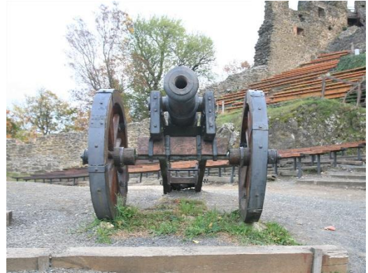
25. kép Egy várvedő ágyú, Szigliget

A Felső-várba egy falszoroson és a farkasvermen (szárazárok) át a néhai felvonóhídon és az Újlaki kapun keresztül juthatunk végül el. A hajdani őrszobával szemben a Mórichidai tornyon lévő "Kígyócskák", a kiskaliberű ágyúk a kapubejárót védték az ostromlóktól, 177 cm hosszú csöveikből 1.76 kg-os vasgolyót tudtak kilőni. A várudvaron tovább haladva egy ciszternát találunk, a balra lévő 3 helyiséges épületben kapott helyet a középkori konyha és sütőház . Itt megismerhetjük a régi idők tűzhelyeit, konyhai eszközeit. A konyha mellett álló Bencés toronyban tárolták a puskaport, ezen lőportorony robbanása okozta a vár tragédiáját. Az udvaron, szemben egy 3 szobából álló épület romja mellett áll a kerek Tömlőctorony , aljában a Várbörtönnel . Az udvarról néhány lépcsőfokot megtéve feljutunk a pince ciszterna platójára, amelyet Martonfalvay Imre várnagy épített át pincéből víztározóvá. Tovább menve elérkezünk a vár déli végéhez. Itt található a legnagyobb beboltozott terme a bencés Szent Márton-várkápolna , amelynek egyszerű belső kialakítása 2010 óta az építető Pannonhalmi (régiben Szent Márton hegyi) Bencés Főapátságnak és a birtokot adományozó IV. Béla királynak állít emléket. A kápolna bejárata mellett felmehetünk a déli falra, és eljutunk a vár legmagasabb pontjához a Királytoronyhoz .