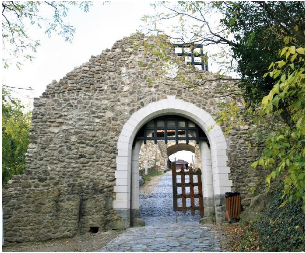
20. kép Az ejtőrácsos Tóti Lengyel kapu, Szigligeti vár

a vár alatt. A 20. sz. folyamán a várfalakat többször megerősítették, majd 2013-ban adták át a közel 302 millió forintból megújult Szigligeti várat, amelyet 2019-2020-ban tovább építettek, de a Covid-19 járvány miatt a felsővár egyes részeinek befejezése 2021-re átnyúlik.