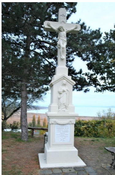
28. kép A Kőkereszt a kápolna előtt