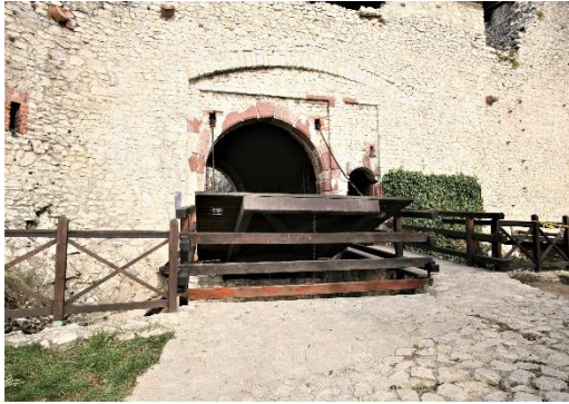
35. kép A Belső kaputorony a felvonóhiddal, Sümegi vár

Közben megérkezünk a kikövezett meredek úton a Külső kaputoronyhoz . A kaptató után érhető, hogy a várat legtöbbször csellel foglalták el, a meredek hegyoldallal nagyobb ostromló török sereg sem próbálkozott soha. A kapu melletti Sennyei bástya romján áll a kapu fölött az építető püspök címere. A pártázatos külső várfal és a belső vár közti falszorosban elérjük Belső kaputornyot , amelyen egy három méter széles felvonóhidas lovaskapu mellett a gyalogkapun jutunk be, a Kapuközön át, a belső udvarra.