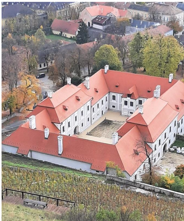
42. kép A Püspöki Palota a várból, Sümeg

kerülnek kialakításra, ahol a vár történetét bemutató kiállítások nyílnak, előadások, vetítések lesznek, de lehetőség nyílik élő történelemórák megtartására is. A látogatók aktívan részt vehetnek a régi mesterségek, a kő- és fafaragás kipróbálásában is.