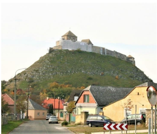
32. kép Sümeg vára a város felett

Sümege a Sopront és a Balatont összekötő 84-es úton 27 km után érkezünk a Vár alatti