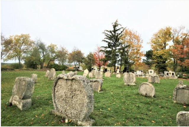
3. kép A szív alakú sírkövek a Balatonudvari temetőben

Balatonudvariban a török hódoltság után a középkori templom romjaira épült a 18.sz közepén a katolikus Szent Márton templom. A század végére az addigra nyomtalanul eltűnt középkori temető területén felépült a református templom is. Eleinte még ide, templom köré temetkezett a falu, de a közállapotok rendezésére az 1770-80-as időszakban egy közös temetőt jelöltek ki, a régi "hadi út" (a 71-es út) túloldalára. A kijelölt temetőbe az 1800-as évektől temetkeztek vegyesen a különböző felekezetek (katolikus, református,