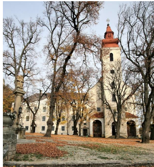
45. kép A Sárlos Boldogasszony ferences templom és Rendház, Sümeg (jobbra)

A kapubejárattól jobbra található a palota barokk stukkókkal és freskókkal gazdagon díszített házi kápolnája. Az erkélyes emeleti részben a vármegye egyik legnagyobb, legimpozánsabb díszterme állt, amelyben megyegyűlést is tartottak. Az épület nyugati részén, a volt társalgóból, nagy nyitott erkély nyílik a kastély díszes kertjébe. Bíró püspök különös gondot fordított a könyvtárára, ami a palota legszebb helyisége volt. Gondos könyvgyűjtő munkájának eredményeképpen a 607 kötetes könyvtára az ő korában igen jelentős gyűjteménynek számított. A könyvtár terem ma üvegművészeti kiállításnak ad otthont.