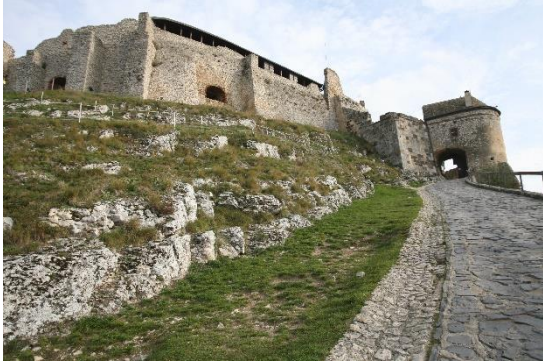
33. kép A meredek út fel a vár Külső kapujához

az ellenséges ostromoknak, az új püspök, Köves András nagyszabású építkezésbe kezdett az olasz Giovanni Speciacasa építész segítségével. Megépült a vár északi sarkán a kétszintes, nagyméretű, ötszög alaprajzú Köves-bástya, és egyéb védművek. Nyolc év építkezés után 1562-ben egy villámcsapás felrobbantotta az Öregtoronyban tárolt lőport, a tűzvészben elpusztult a vár egy része és a tetőszerkezet, melyek kijavítására 200 forintot utalt ki Miksa főherceg. Ezt követően átépítették az egész belső várat, a tornyot, és a vár lakóépületeit is átalakították reneszánsz stílusban.