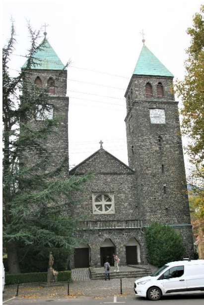
14. kép A Szent Imre-bazilika kőből épített templom Badacsonytomaj