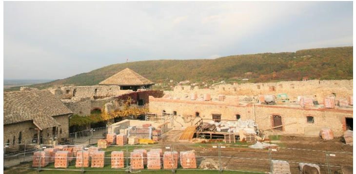
41. kép Elkezdődött a Sümegi vár keleti szárnyának újjáépítése a Köves bástyától a kápolnáig.

kerülnek kialakításra, ahol a vár történetét bemutató kiállítások nyílnak, előadások, vetítések lesznek, de lehetőség nyílik élő történelemórák megtartására is. A látogatók aktívan részt vehetnek a régi mesterségek, a kő- és fafaragás kipróbálásában is.